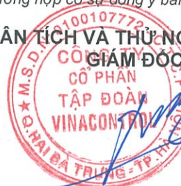
Đỗ Phúc Tuyển

TRUNG TÂM PHÂN TÍCH VÀ THỬ NGHIỆM 1 - VINACONTROL