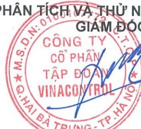
Đỗ Phúc Tuyến