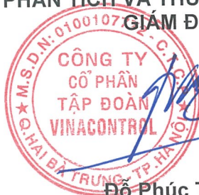
Đỗ Phúc Tuyên