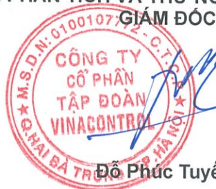
Đỗ Phúc Tuyên

TRUNG TÂM PHÂN TÍCH VÀ THỬ NGHIỆM 1 - VINACONTROL