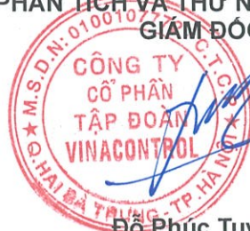
Đỗ Phúc Tuyền