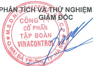
Đỗ Phúc Tuyên